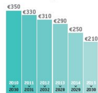
Waarde 1 GSC-systeem

De overheid steunt het gebruik van hernieuwbare energie onder meer door het GSC-systeem of groenestroomcertificaten. Dit zijn virtuele certificaten die u van de VREG ontvangt voor elke 1000kWh elektriciteit die u produceert.